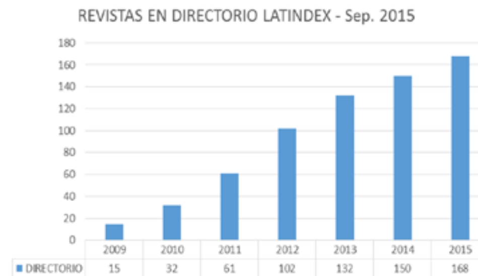
Gráfico 1 – Evolución del número de revistas de Nicaragua en el Directorio Latindex

Actualmente tenemos disponible 168 revistas en el Directorio, 11 en el Catálogo y 88 Revistas electrónicas. Del total de revistas en el Directorio un 59.5% (100) son revistas de divulgación científica y cultural, el 28.5% (48) son revistas técnicas y profesionales y el 11.9% (20) son de investigación científica. Las temáticas que se destacan en las revistas en primer lugar son las de Ciencias Sociales, segundo lugar las Multidisciplinarias y en tercer lugar las Ciencias Agrícolas.