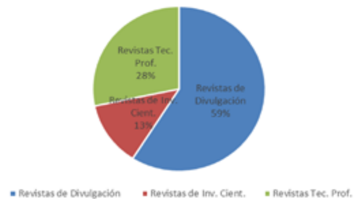
Tipos de revistas en Nicaragua