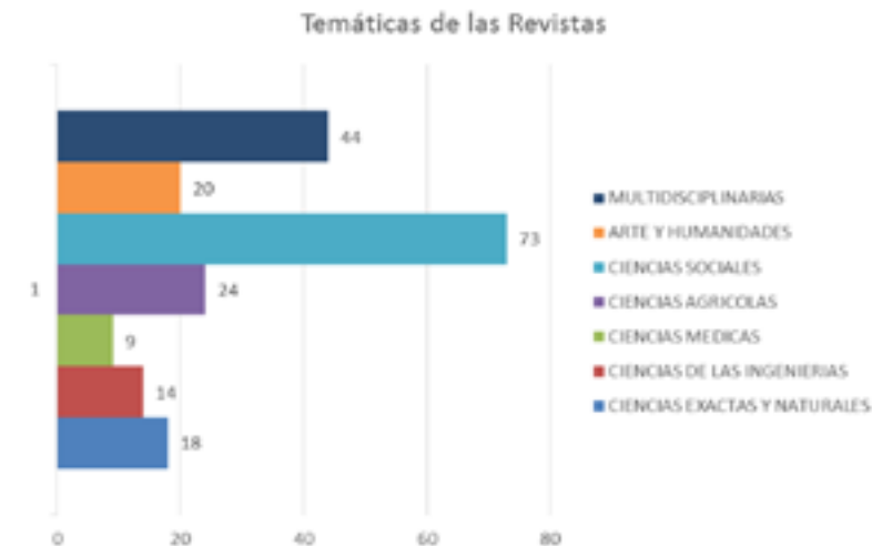
Gráfico 4. Revistas de Nicaragua por temas