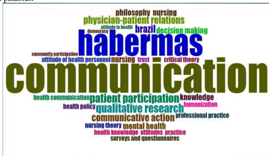
Figura 2 -Nuvem de palavras.

Graficamente, a construção de Nuvem de palavras (nuvem de tags ou texto) permite uma representação visual da frequência e do valor das palavras. Nos artigos selecionados para esta pesquisa, a palavra comunicação é a mais utilizada, por isso, aparece maior e mais forte.