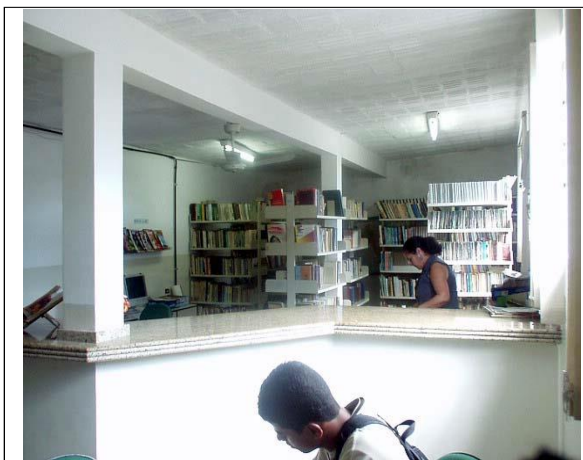
Figura 3 – Exemplo de descrição de fotografia da categoria estrutural.

Para a categoria estrutural demonstraremos uma fotografia da biblioteca da instituição do ano de 2004, seguida dos metadados, conforme Figura 3.