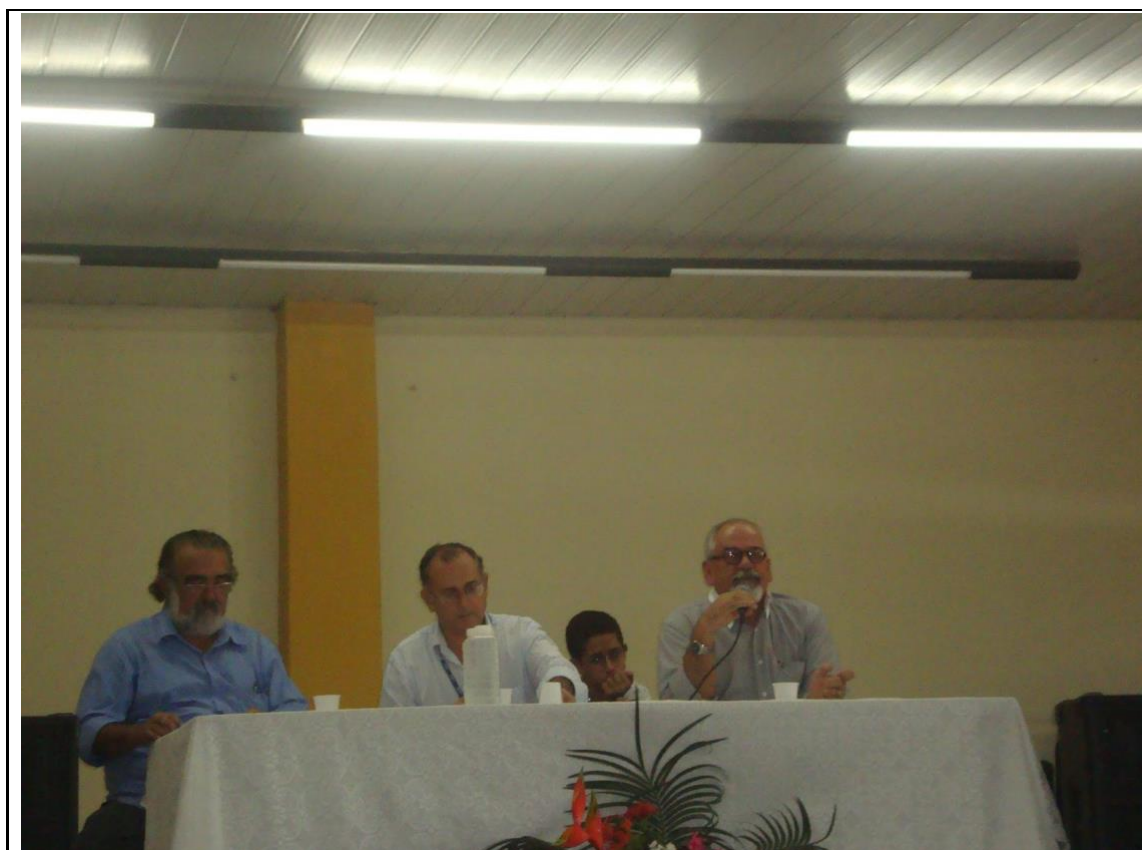
Figura 2 – Exemplo de descrição de fotografia da categoria política.