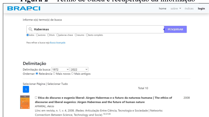
Figura 2 – Termo de busca e recuperação da informação