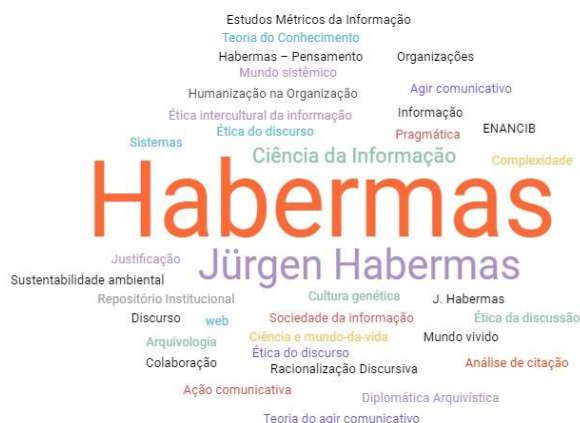
Figura 1 – Tags das palavras-chave dos artigos da amostra.