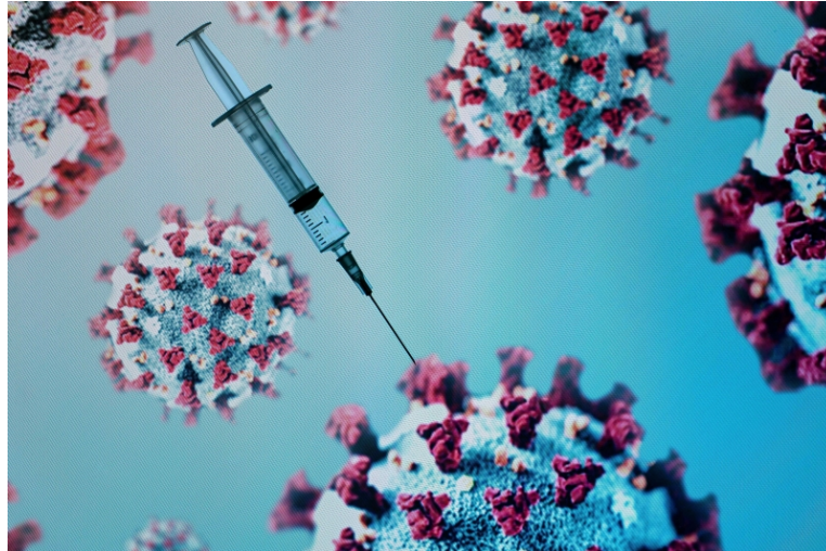
Imagem 1 - Conteúdo Especial Coronavírus (Jornal do Comércio)

não só registrou que a inoculação podia causar mutilação e morte, como não contava com evidência suficiente a respeito do próprio conceito de vacina (UNNA, 2003, p. 466). Porém, o conhecimento científico sobre as vacinas progrediu imensamente em relação àquele começo luminoso no final do Século das Luzes, como pode ser representado pela Imagem 1, em claro contraste com o quadro satírico apresentado mais abaixo: