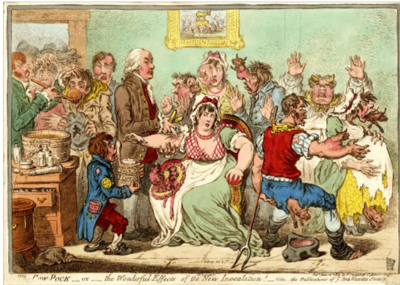
Imagem 2 - James Gillray. The Cow-Pock-or-the Wonderful Effects of the New Inoculation! 1802. 10