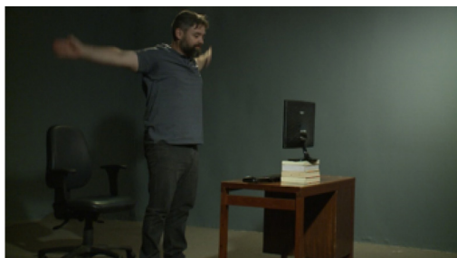
Figura 3 – Imagem do curso Saúde do Trabalhador