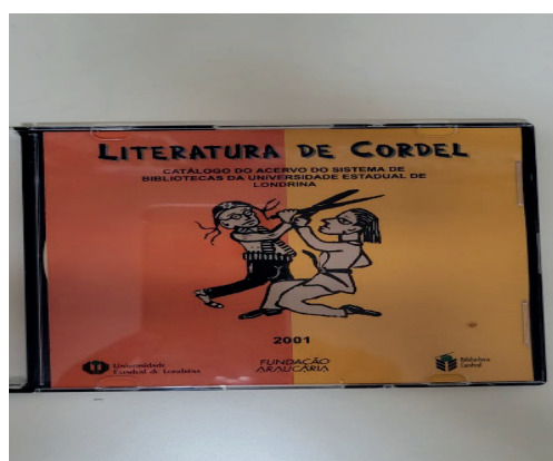
FIGURA 3 – CD-ROM