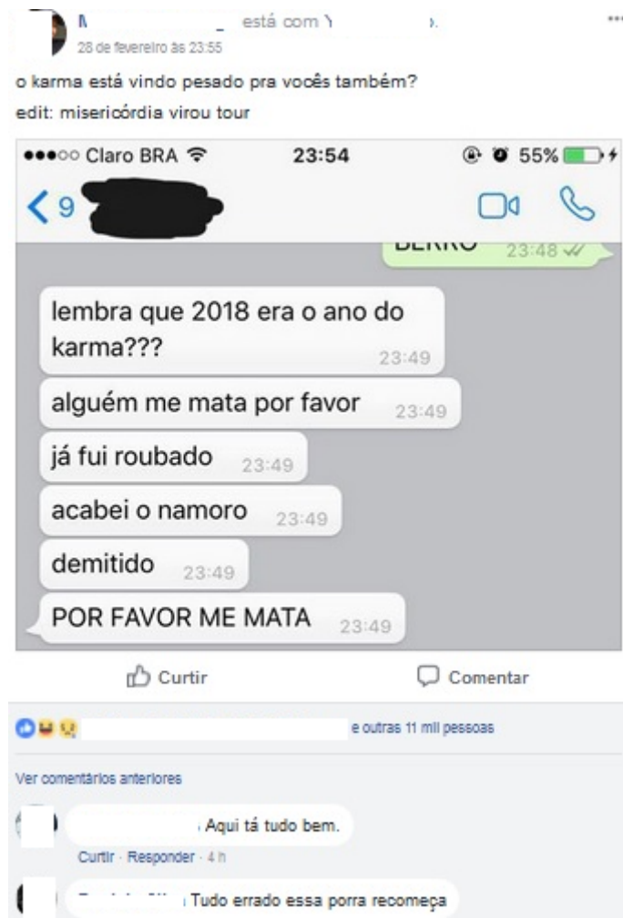
Figura 1 - Memória e o karma

Uma dinâmica desenvolvida no Vale, nos permite refletir acerca da memoração (FIGURA 1):