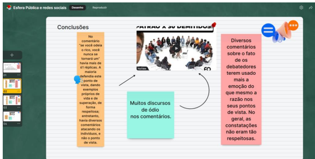
Figura 2 – Mural com conclusões dos alunos a partir da análise de comentários

Na aula seguinte, foi o momento de compartilhar os achados. Dessa forma, as duplas apresentaram suas conclusões, que eram ouvidas por todos e anotadas no Padlet. Os estudantes tiveram a chance de mostrar os apontamentos e ouvirem as impressões dos colegas, expondo suas percepções e concordâncias sobre seus resultados. A discussão levantada pelos alunos concentrou-se em tópicos como a importância da linguagem respeitosa, a intolerância e os limites do humor. Uma das sínteses das análises organizadas pelos alunos na plataforma Padlet pode ser verificada nas figuras a seguir (Figuras 2).